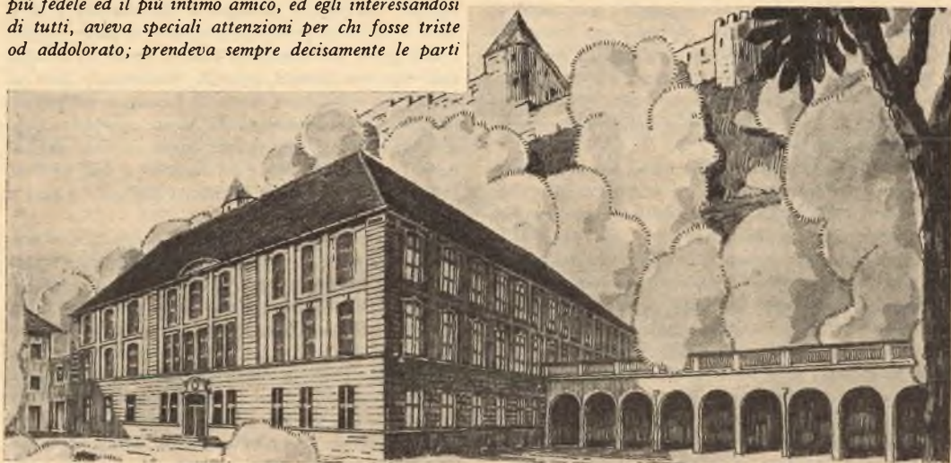
Burghausen. - L'istituto salesiano.