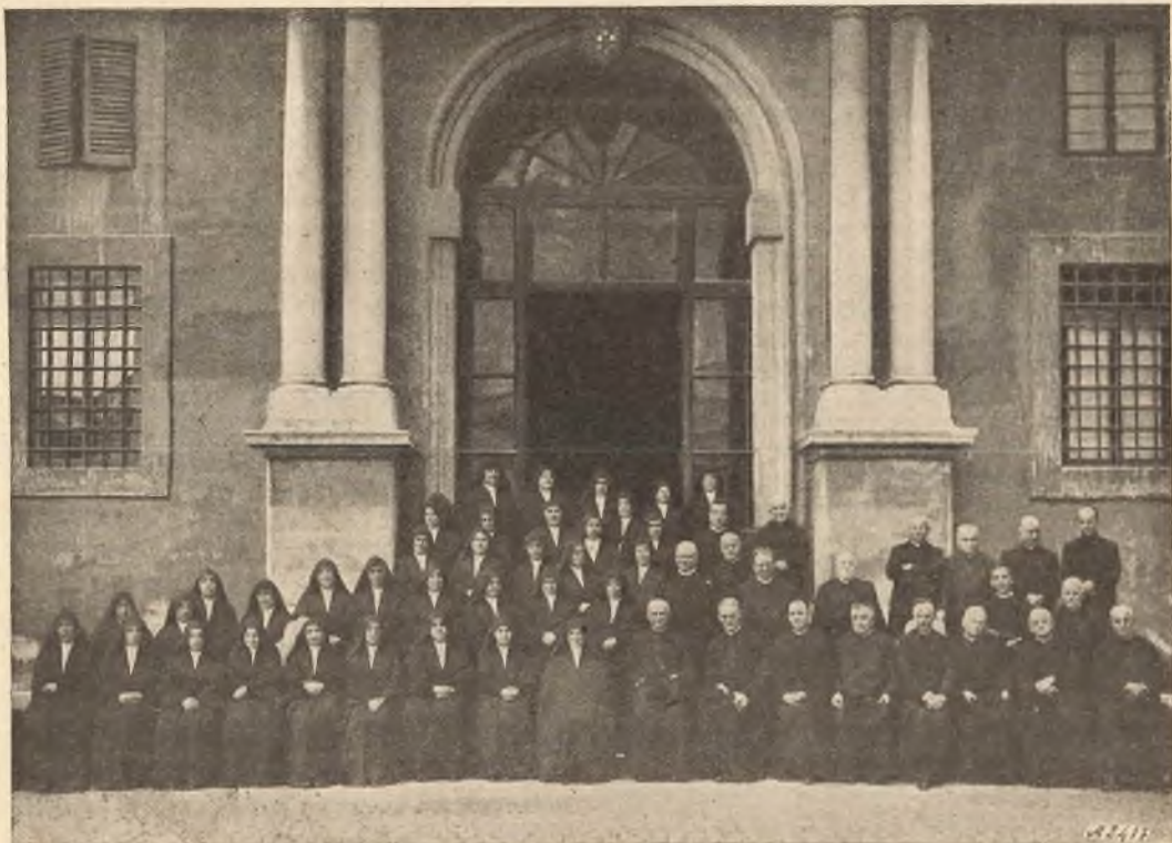
Roma. - Il Consiglio Generalizio dell'Istituto delle Figlie di Maria Ausiliatrice col Rettor Maggiore, Superiori, Ispettori ed Ispettrici, dopo l'udienza pontificia.

C'è da fare anzitutto una constatazione: questa piccola, semplice, povera contadinella, che aveva soltanto una formazione rudimentale, dimostra ben presto quel che si dice un talento, uno dei più grandi talenti: il talento del governo. Grandissima cosa questa: ed ella dimostra di possederla e la possiede a tal punto che un uomo come San Giovanni Bosco, il famoso don Bosco, così profondo conoscitore di uomini, e così intelligente ed esperto nel governo di uomini e di cose, scorge subito quel raro e prezioso ta-