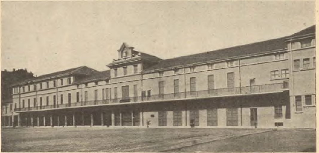
Torino. - Il nuovo edificio del primo Oratorio festivo di Don Bosco.

Il coro imponente dei giovani cantò l'inno della canonizzazione Campane suonate ; quindi il Presidente del circolo dell'associazione oratoriana di Azione Cattolica, Angeleri, prese la parola per celebrare il fausto compimento della sistemazione definitiva del Primo Oratorio fondato da S. Giovanni Bosco. Con rapida sintesi percorse le tappe della sua vita gloriosa dalla presa di possesso della tettoia Pinardi (12 aprile 1846) all'anno corrente, rilevando la messe di bene, raccolta nel corso di 90 anni, e ringraziando il Rettor Maggiore per la magnifica trasformazione edilizia che permetterà nuovi sviluppi dell'attività salesiana.