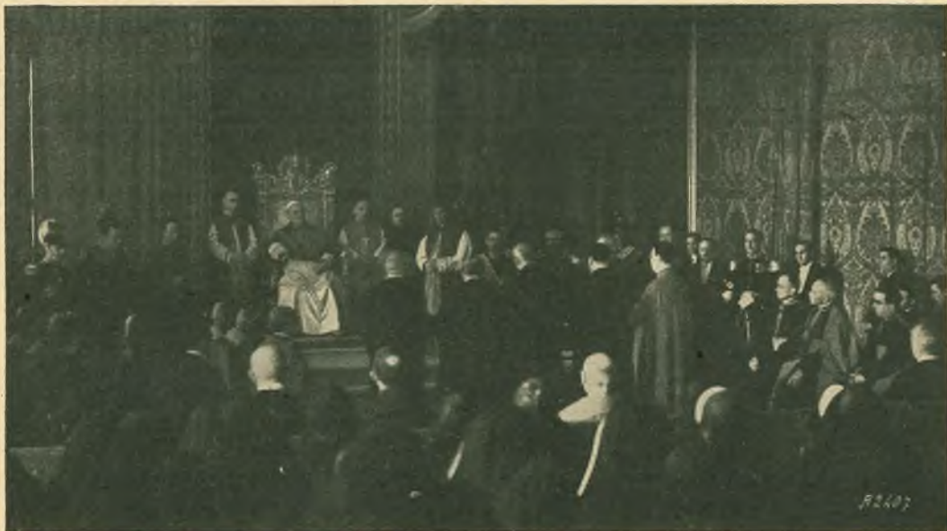
Roma. - La proclamazione dell'eroicità delle virtù della Ven. Madre Maria Mazzarello. Il Santo Padre ascolta l'indirizzo del Rettor Maggiore.